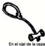
En el ojal de la capa

Estos bocetos de BP muestran el diseño desarrollado para la Insignia de Madera