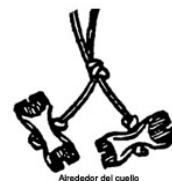
Alrededor del cuello