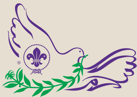
Mensajeros de la Paz ECUADOR

https://view.genial.ly/5e79a3282dc19c0de0106ba5