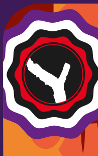
Obtención por cuarta vez