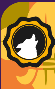
Obtención por segunda vez