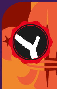
Obtención por primera vez