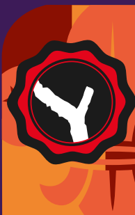
Obtención por segunda vez