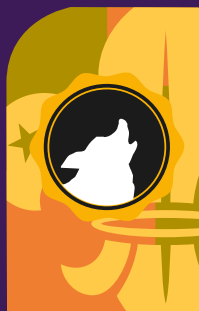
Obtención por primera vez